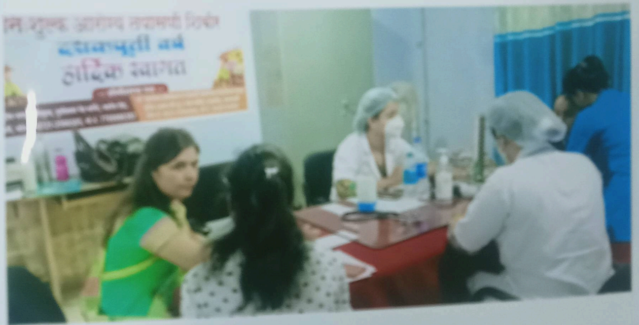
आरोग्य तपासणी करताना विद्यार्थीनी