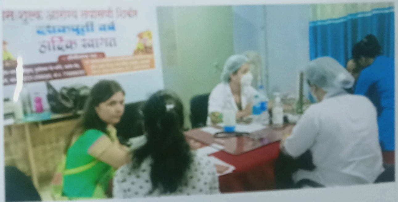
आरोग्य तपासणी करताना विद्यार्थीनी